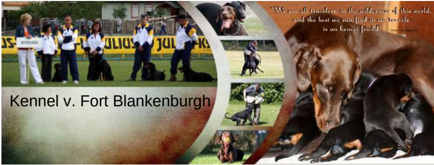
Kennel v. Fort Blankenburgh