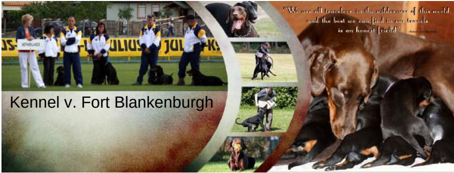
Kennel v. Fort Blankenburgh